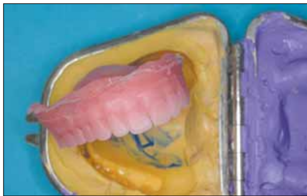
Εικόνα 2: Αφαίρεση του αντιγράφου της ολικής οδοντοστοιχίας από το έγκλειστρο αντιγραφής (κέρινα δόντια και ακρυλική βάση).

Με βάση τα δεδομένα από το ιστορικό και την κλινική εξέταση αποφασίστηκε η κατασκευή ζεύγους νέων οδοντοστοιχιών με την τεχνική της αντιγραφής και αφού ενημερώθηκαν ασθενής και συνοδός για τις δυσκολίες που ενδεχομένως ανακύψουν, δόθηκε η απαραίτητη συναίνεση. Στην πρώτη συνεδρία η ασθενής παρέδωσε τις οδοντοστοιχίες που έφερε και αποχώρησε αφού της δόθηκαν οδηγίες να μη χρησιμοποιήσει τις εφεδρικές που διατηρούσε για τις επόμενες δύο ημέρες μέχρι δηλαδή το επόμενο ραντεβού, προσαρμόζοντας αναλόγως και το διαιτολόγιό της. Στο εργαστηριακό στάδιο που μεσολάβησε οι υπάρχουσες οδοντοστοιχίες αντιγράφηκαν με τη βοήθεια ειδικού έγκλειστρου αντιγραφής 7 . Από τη διαδικασία αυτή προέκυψε ζεύγος ομοίωτων οδοντοστοιχιών με ακρυλική βασική και κέρινα δόντια. Για τις βασικές χρησιμοποιήθηκε εν ψυχρώ πολυμεριζόμενο ακρυλικό (Weropress, Merz Dental GmbH, Lütjenburg, Germany), το οποίο μετά τον στοιβαγμό στο έγκλειστρο αντιγραφής, εμβυθίστηκε σε χύτρα πολυμερισμού με ζεστό νερό στους 50 °C και αφέθηκε να πολυμεριστεί για 30 λεπτά σε 2 bar πίεση. Μετά την απεγκλειστρωτική αφαίρεση των περισσεύσεων ακρυλικού και έγινε η απαραίτητη στίλβωση (εικ. 2).