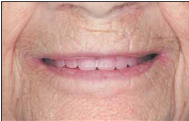
Εικόνα 5: Έλεγχος αισθητικής και γραμμής γέλωτος με τις ομοιότυπες οδοντοστοιχίες.

οδοντοστοιχίες επεστράφησαν και η ασθενής αποχώρησε. Στο εργαστηριακό στάδιο που ακολούθησε και αφού χυτεύθηκαν εκμαγεία στις αναπροσαρμοσμένες βασικές πλάκες, έγινε ανάρτηση στον αρθρωτήρα και ολοκληρώθηκε η σύνταξη των τεχνητών δοντιών.