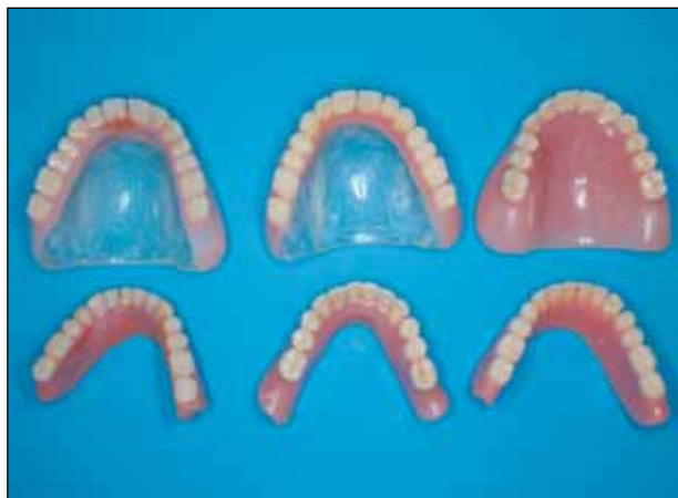
Εικόνα 1: Συλλογή των οδοντοστοιχιών που έφερε η ασθενής την τελευταία 5ετία.

Η εξωστοματική και ενδοστοματική κλινική εξέταση απο-