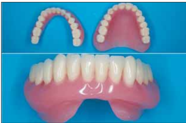
Εικόνα 9: Οι οδοντοστοιχίες μετά την όπτηση και στίλβωση. Χαρακτηριστική η μορφολογία της κάτω οδοντοστοιχίας και ιδιαίτερα η έκταση των γλωσσικών πτερυγίων στα λειτουργικά επιτρεπόμενα όρια του ασθενή.

στίλβωση των οδοντοστοιχιών και τέλος πριν την παράδοσή τους τοποθετήθηκαν για τουλάχιστον 24 ώρες σε αεροστεγείς συσκευασίες με ατμόσφαιρα κορεσμένων υδρατμών με σκοπό την αποφυγή στρέβλωσης (εικ. 9).