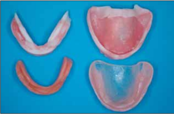
Εικόνα 3: Άμεση αναπροσαρμογή των βασικών πλακών με μαλακό επίστρωμα (άνω σειρά). Είναι χαρακτηριστική η προσθήκη υλικού στις περιοχές ελλειμματικής έκτασης των οδοντοστοιχιών.