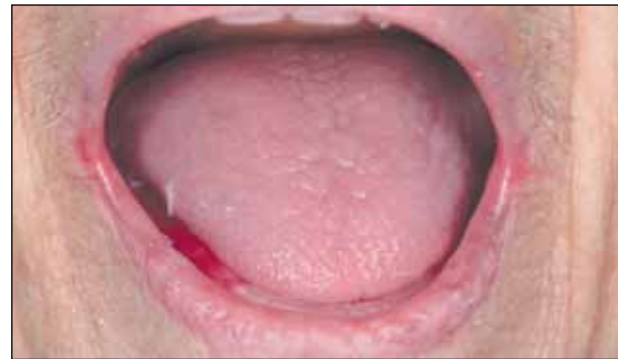
Εικόνα 6: Έλεγχος κατά την μέγιστη διάνοιξη με τις ομοιότυπες οδοντοστοιχίες. Είναι εμφανής η άμεση ενεργοποίηση του εγκατεστημένου μηχανισμού νευρομυϊκής προσαρμογής. Η κάτω οδοντοστοιχία παραμένει καθηλωμένη μεταξύ της γλώσσας και των μυών των παρειών και του κάτω χείλους.

λες τροποποιήσεις όπου αυτό ήταν απαραίτητο (εικ. 7). Ακολούθησε η λήψη τελικού διορθωτικού αποτύπωματος με λεπτόρευση σιλικόνη προσθήκης για την κάθε οδοντοστοιχία ξεχωριστά, με προσοχή στη διατήρηση