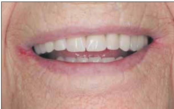
Εικόνα 7: Κλινικός έλεγχος της σύνταξης. Τα κέρινα δόντια έχουν αντικατασταθεί προσεκτικά με καινούργια ακρυλικά αντιστοιχείου μεγέθους και σχήματος, ώστε να διατηρηθεί το αισθητικό profile της ασθενούς.

Στην τρίτη κλινική συνεδρία ελέγχθηκαν η σύγκλειση, η αισθητική και η φωνητική απόδοση και έγιναν κατάλλη-