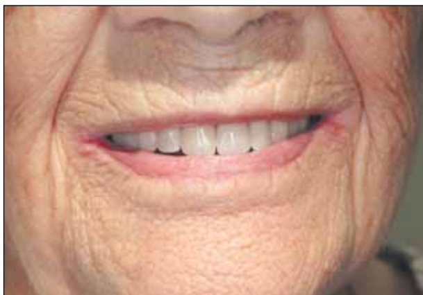
Εικόνα 10: Κλινική εικόνα με τις καινούργιες οδοντοστοιχίες.

Στην τελευταία κλινική συνεδρία έγινε η παράδοση των οδοντοστοιχιών, επίδειξη στοματικής υγιεινής και δόθηκαν οδηγίες συντήρησης και χρήσης παρουσία της φροντιστού (εικ. 10). Κατά τον επανέλεγχο διαπιστώθηκαν σημεία υπερπίεσης οφειλόμενα κυρίως στην κάτω οδοντοστοιχία, τα οποία και διευθετήθηκαν. Η ασθενής αποχώρησε χωρίς περεταίρω προβλήματα και δεν επανήλθε.