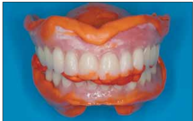
Εικόνα 8: Τελικό διορθωτικό αποτύπωμα στο στάδιο ελέγχου της σύνταξης και πριν την όπτηση με λεπτόρευση σιλικόνη προσθήκης.

λες τροποποιήσεις όπου αυτό ήταν απαραίτητο (εικ. 7). Ακολούθησε η λήψη τελικού διορθωτικού αποτύπωματος με λεπτόρευση σιλικόνη προσθήκης για την κάθε οδοντοστοιχία ξεχωριστά, με προσοχή στη διατήρηση