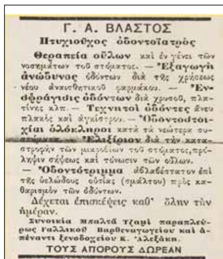
Εικόνα 2: Η ανακοίνωσή του Γ. Βλαστόύ στην εφημερίδα Ελευθερία (Ηρακλείο) της 10/4/1899.

Όσον δια την εξαγωγήν των ριζών και οδόντων και άλλα ασθενείαι, αι οποίαι συνεπάγονται εις την οδοντιατρικήν σπανίως παρουσιάζονται παρ ημίν, διότι οι έχοντες τοι-