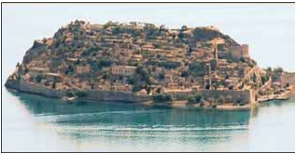
Εικόνα 4: Η νήσος Σπιναλόγκα.