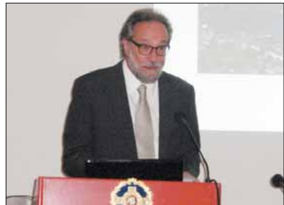
Ο Πρέσβης της Ελβετίας στην Ελλάδα κ. Lorenzo Amberg απευθύνει χαιρετισμό.